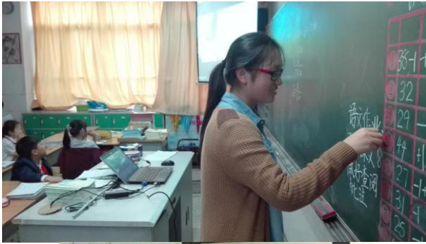
小顾老师在布置家庭作业~