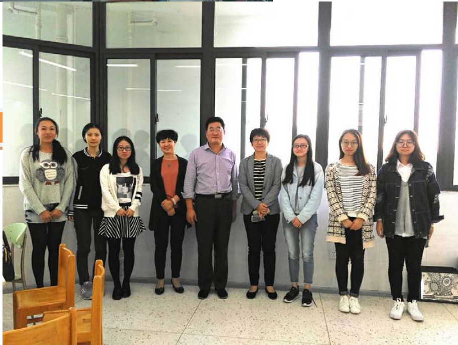
小唐老师在教授数学，